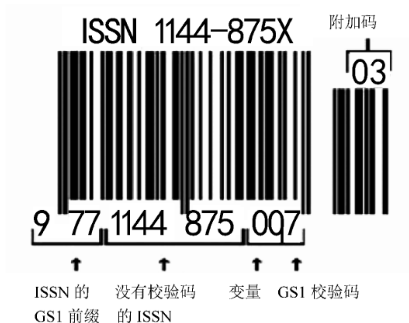
图 E.1 带条码的 ISSN 范例

另外,也可能会有 2 位或 5 位附加码加在 13 位数字的条形码上。这样可以有更多的空间来表示有关该产品的其他信息。在基于 ISSN 分配的、GS1 前缀为 977 的条形码上,附加码通常是两位数,表示连续出版物的刊期。这对于有效管理库存很重要。然而,不是所有电子销售点 (EPOS) 系统都能扫描附加码,因此需要使用单独的手动或自动库存管理系统。