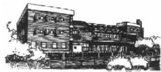
图 6 清华大学学生活动中心 Fig.6 Students Activities Center of Tsinghua University

清华大学学生文化活动中心(图6), 在设计中注重延续清华校园的历史文脉, 其白色的檐口和勒脚以及红色的毛面砖都体现了典型的清华老校园的建筑风格和特色; 同时, 根据其所处位置的特殊性, 在沿河立面布置了一系列开敞和通透的空间, 局部采用坡顶, 屋顶平台上设斜向遮阳梁架, 使建筑舒展、流畅, 形成其独有的个性 [7] .