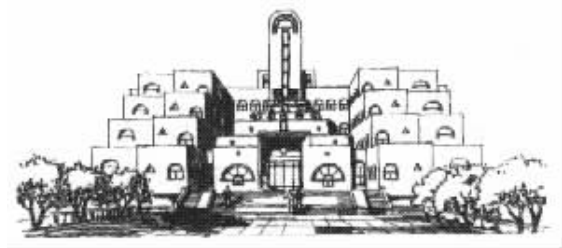
图 4 吐鲁番宾馆新楼 Fig.4 The new Building of Tulufan Hotel

合肥市花溪饭店餐厅(图5)设计时借鉴徽州民居, 并用现代手法创造了新徽派的建筑风格.