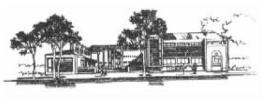
图2 南京梅园纪念馆

环境的结合。如果每一幢中小型民用建筑都十分耀眼,标新立异,以自我为中心,那么我们的城市环境不是充满了视觉紧张吗?我们不能通过个别的建筑去看城市,而是要将建筑物与城市联系起来看。设计中要认真推敲所设计的建筑与相邻建筑的形体和空间关系,使建筑与环境融为一体。荣获1988年全国优秀设计一等奖的南京梅园纪念馆(图2),以“建筑环境的和谐,历史环境的再现”作为创作的中心思想,一方面将纪念馆融合到城市环境中,另一方面使观者触景生情,从而达到对历史事件的纪念。纪念馆不自我突出,避免哗众取宠,以青灰色面砖和黑色机瓦的两层坡顶建筑形象统一在里弄街坊的环境之中,宜人的比例、亲切的尺度构成了一座典雅的地方特色的时代建筑 [5] 。深圳蛇口明华中心(图3)设计时充分利用地形,依山就势,外部空间与环境融为一体,体形错落有致,空间富有变化,建筑轮廓与山体相呼应,形成独特的造型,依据山势将培训和酒店分开,分层布置出入口,互不干扰又能互相连通,功能分区合理 [6] 。