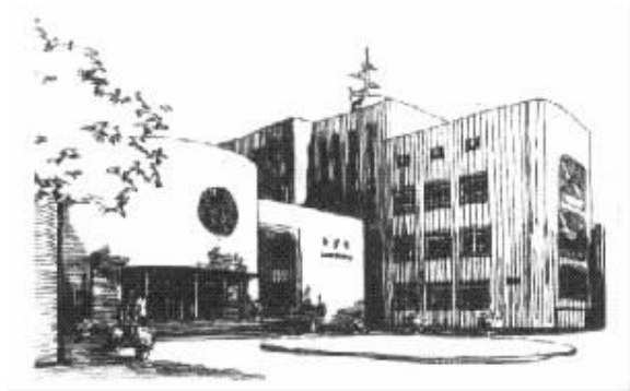
图 1 同济大学逸夫楼

对于大的东西 , 人们往往比较关注 , 在建筑界也是如此 . 大型工程通常会引起人们的重视 , 一些中小型民用建筑则常被冷落 , 如果建筑师都来关注中小型民用建筑的创作 , 也会设计出精品建筑 . 例如同济大学逸夫楼 ( 图 1 ) 建筑面积仅六千多平方米 , 该建筑的室内外空间处理比较好 , 尤其是在 2 个不大的中庭处理上 , 有较突出的创造性 , 共同构成了一个多变化、多用途、多层次的功能艺术中心 . 整座建筑从整体到细部处处都有创新 , 连装修材质都体现了建筑师的独具匠心之处 . 这些为该建筑赢得了包括 1995 年建设部优秀建筑设计一等奖在内的 6 项大奖 , 并成为同济大学校园内标志性建筑之一 [1] . 从这些优秀的设计可以看出 , 建筑创作层次的高低 , 并不取决于建筑类型、建筑规模和建筑标准 , 关键在于是否精心设计 .