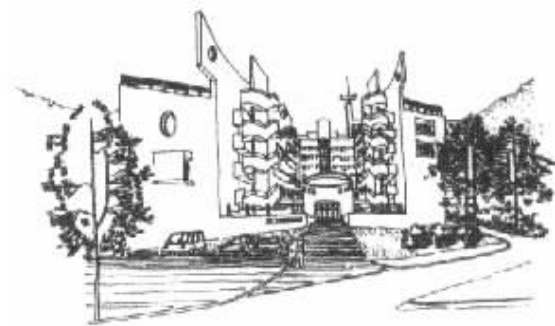
图3 深圳蛇口明华中心